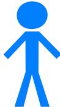
Spécialiste des métadonnées