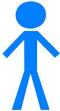
Chef de projet